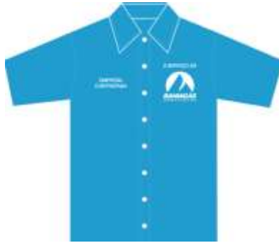
Modelo de camisa para uniforme

6.4.10. Para as equipes de obras civis, a CONTRATADA deverá fornecer no mínimo 02(dois) conjuntos por semestre, contendo calça e camisa de manga comprida na cor laranja, com faixa retro refletiva (conforme Anexo IV – Especificações de Fardamento – NA-03.10-036 ou conforme a NBR 15292 – Vestimenta de segurança de alta visibilidade), com logotipo da empresa e repor a cada 6 (seis) meses ou de acordo com o item 18.37.3 da NR-18 quando danificados, as suas subcontratadas devem seguir as mesmas orientações (é necessária a aprovação prévia da CONTRATANTE);